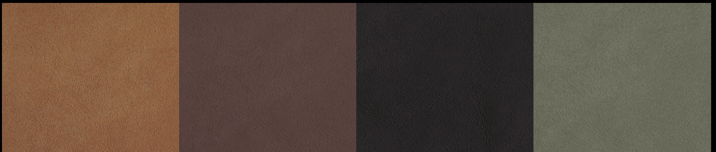
TRIBE col. CAPREUVA