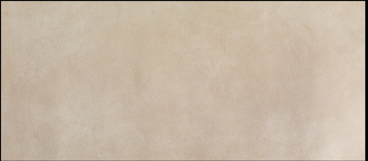
TRIBE col. STONE