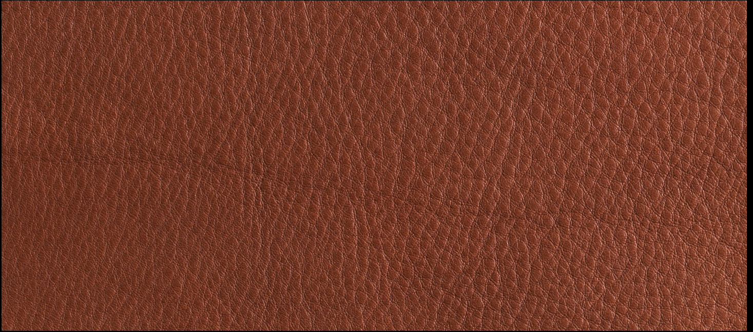
LIKE col. BARK