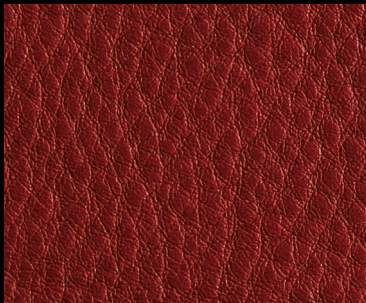
LIKE col. BRUN