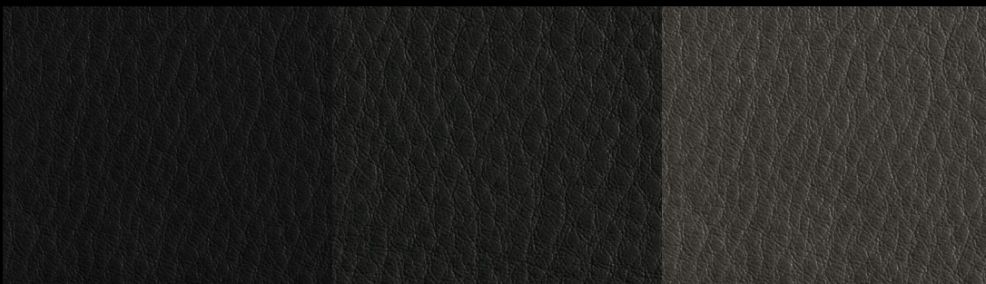
LIKE col. BLACK