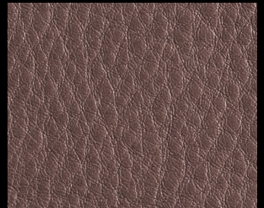
LIKE col. SMOG