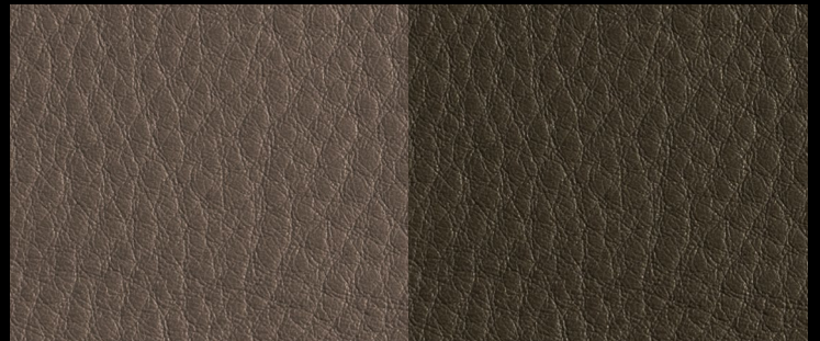
LIKE col. TAUPE