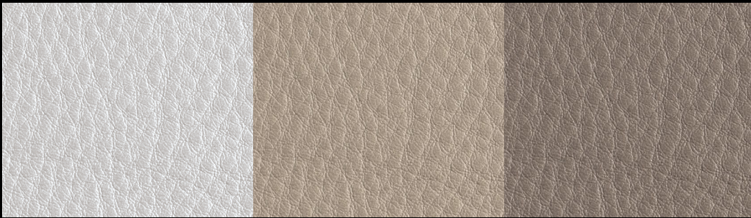
LIKE col. WHITE