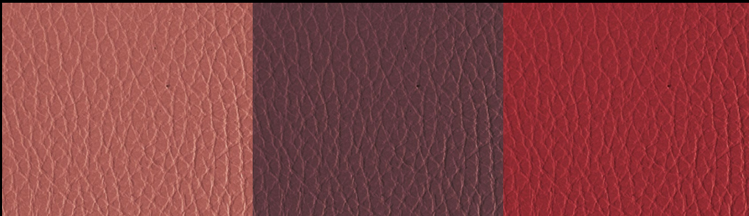
IGNIFUGO col. 809