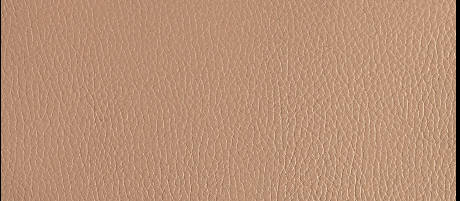
IGNIFUGO col. 814