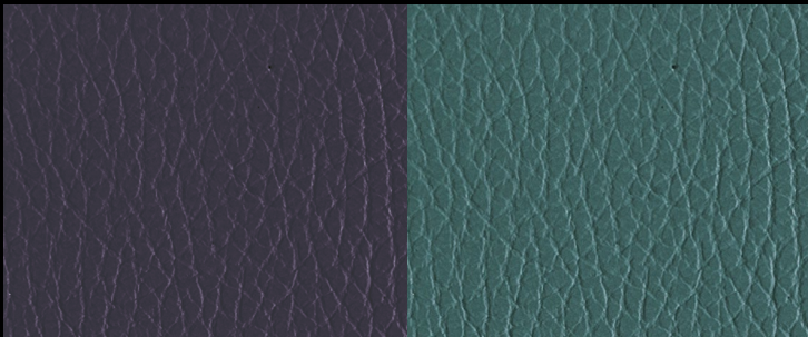
IGNIFUGO col. 807