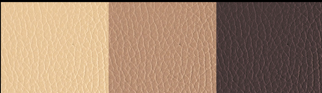
IGNIFUGO col. 810