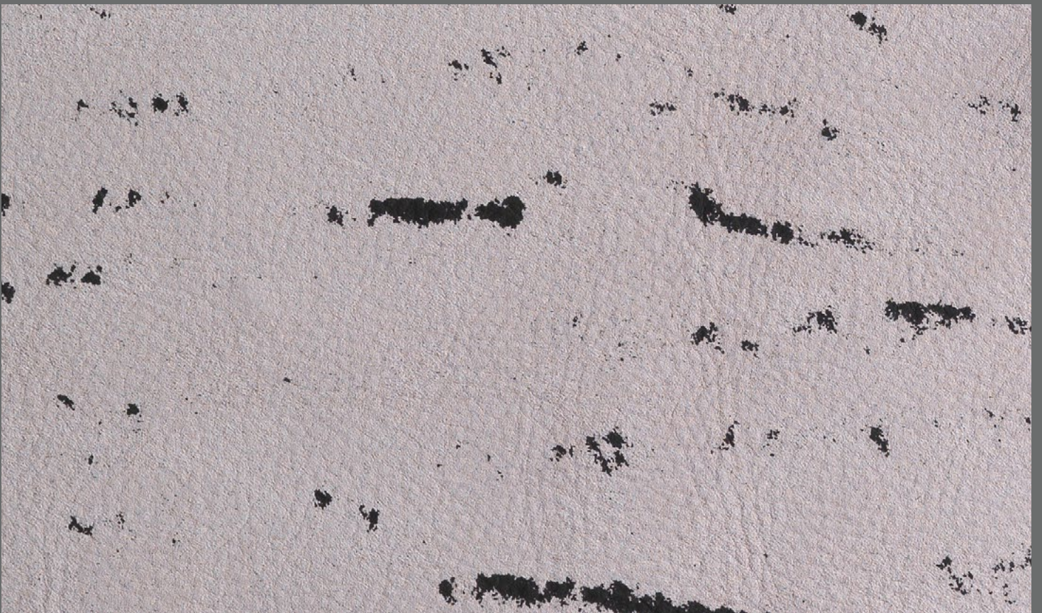
PIETRA col. BLACK