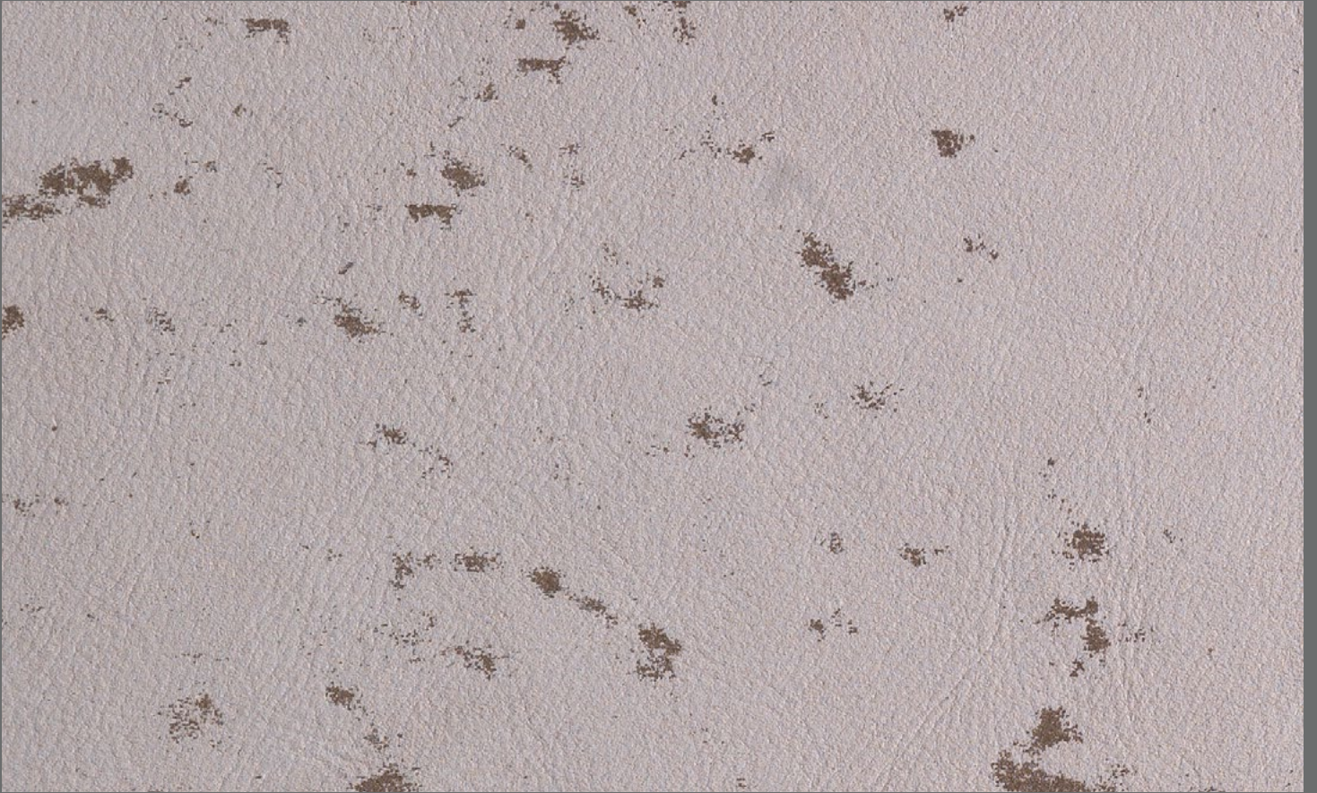
PIETRA col. VISONO